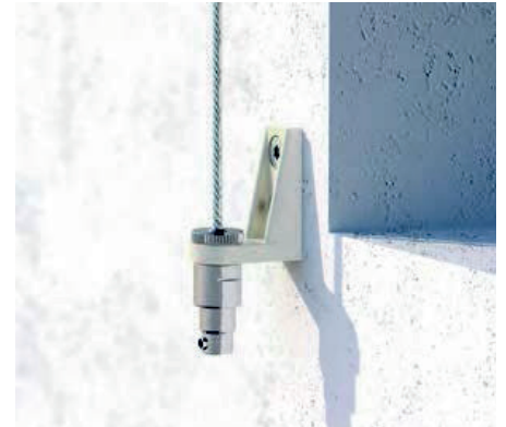
Wandhalter inkl. Federspanntopf