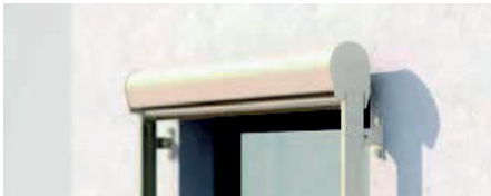
VS4300 Eckiger und runder Kasten