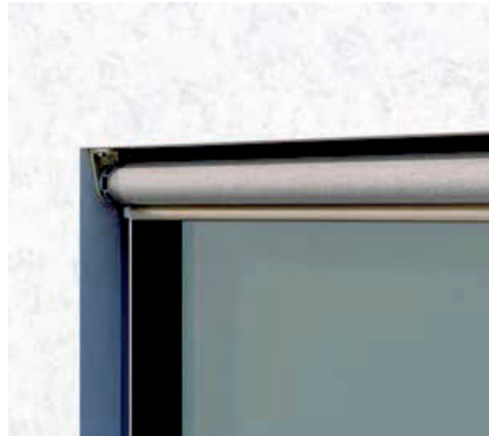
S4110 Ohne Kasten