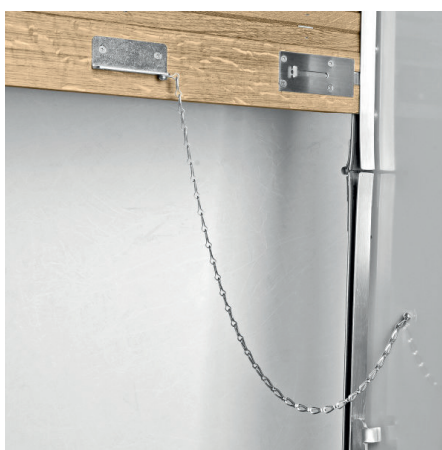
Handgriff mit Zugkette