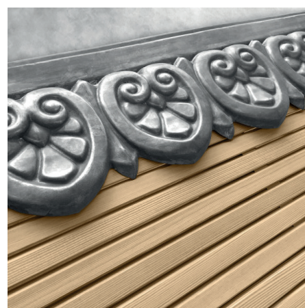
Antike Galerieblende aus Zinkblech