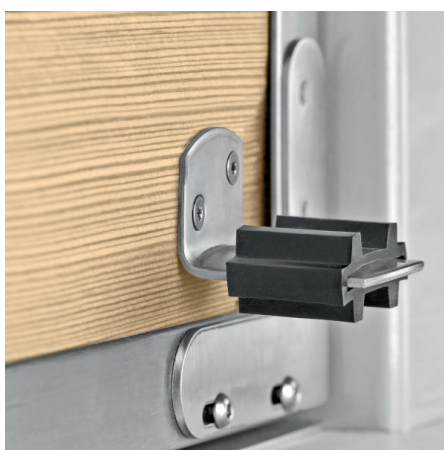
Anschlagswinkel mit Gummistopper