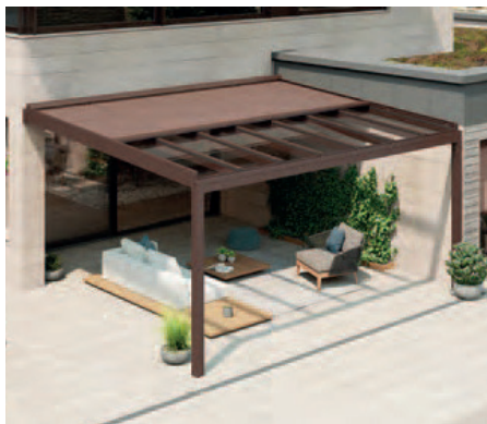
NYON PLUS GP4100 mit Überglasmarkise