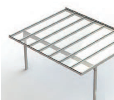
NYON GP4200 Querbalken zurückversetzt